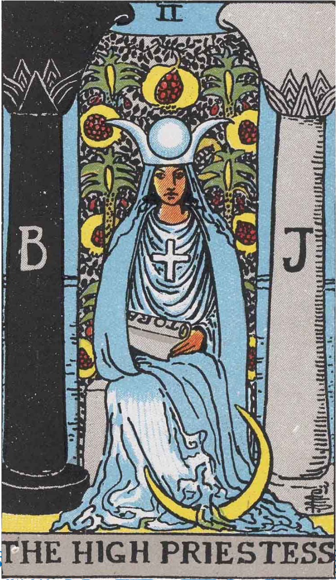
THE HIGH PRIESTESS