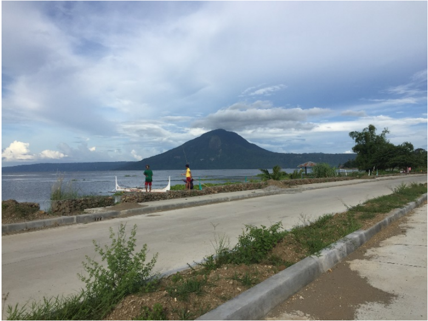
FIG. 2. Ang dating pampang ay ginawang sementado at ngayon ay bahagi na ng baywalk.