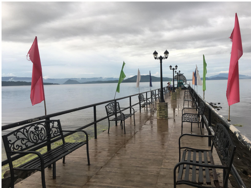
FIG. 3. Isang bahagi ng pantalan/baywalk kung saan madalas na nakatambay ang mga beki.