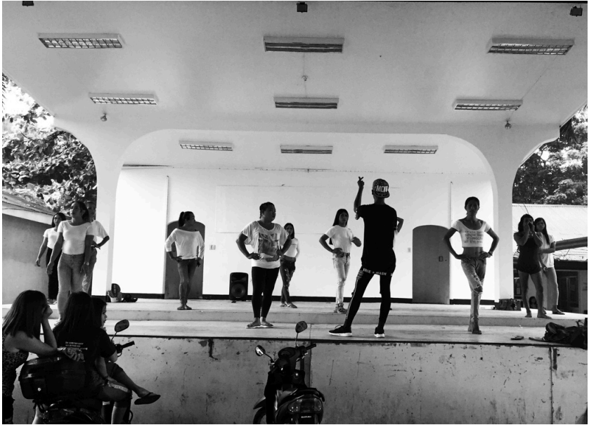
FIG. 4. Ang ilang mga beki ay kasali sa pagrampa sa patimpalak na Ms. Gay San Nicolas, isa sa mga programa sa gabi ng piyesta ng bayan. Ang larawan ay kuha ng mananaliksik.