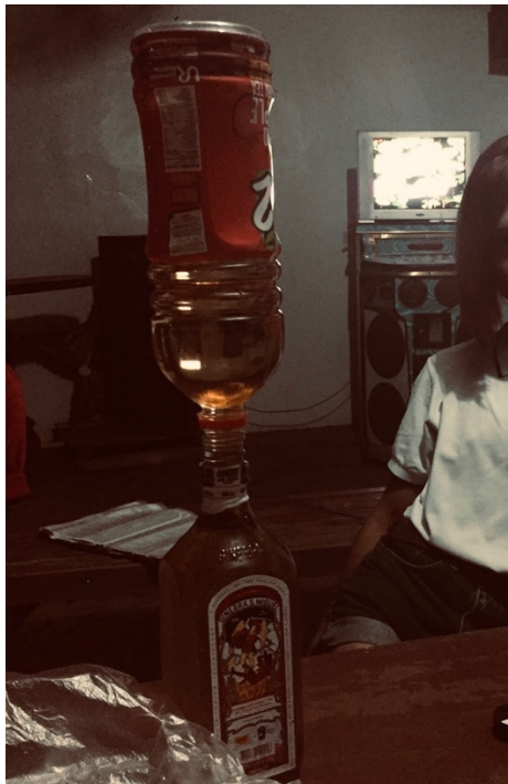
FIG. 5. Kuha sa isang inuman. Isang paraan ng paggawa sa inuming pagsasaluhan – ang magkahalong iced tea at gin.

Bukod sa nagiging pagkakataon upang makabuo ng mga bagong relasyong sosyal, ang inuman bilang isang aktibidad ay nagsisilbing tagpuan ng mga beki upang magpalitan ng mga kuwento tungkol sa kanilang pang-araw-araw na buhay. Mahalaga ang pagiging regular ng aktibidad na ito lalo pa at ang mga kapwa beki ang pinaka-nakakaunawa sa kanilang mga pinagdadaanan sa pag-ibig man, pamilya o problemang pinansyal dahil sa pagkakahalintulad ng kanilang mga karanasan.