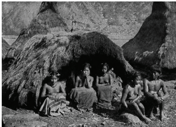
Larawan blg. 4: The "olag," where certain unmarried women live in Bontoc. (Boyce 1914, 95)