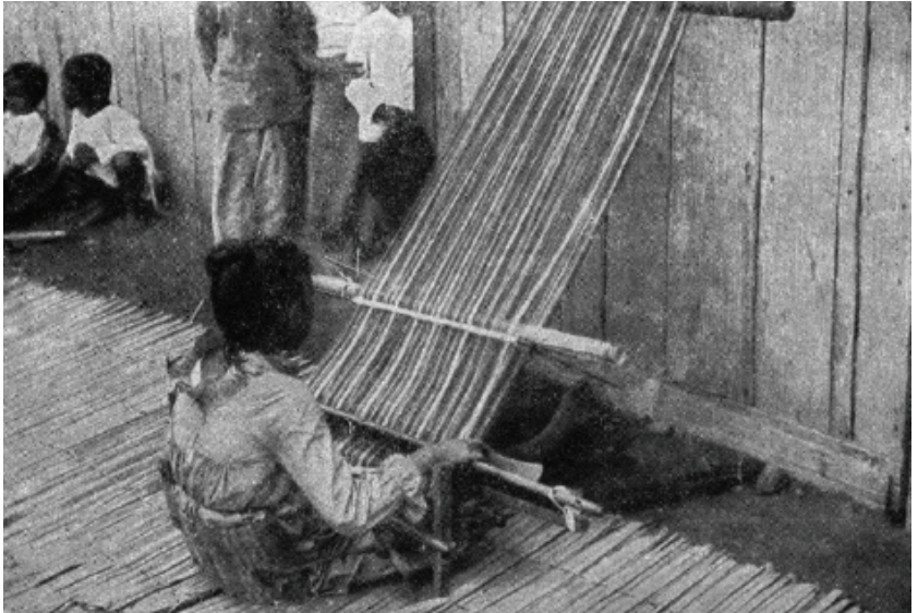
Larawan blg. 8: A Moro weaver. (Atkinson 1905, 253)