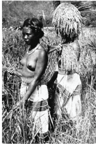
Larawan blg. 3: Bontoc girls harvesting rice. (Barton 1930, 12)

Samantala, sa Larawan 3 ay makikita ang dalawang babaeng Bontoc na walang suot na pang-itaas habang nag-aani ng palay. Ipinakikita naman sa Larawan 4 ang apat na babaeng Igorot at isang lalaking Igorot sa harap ng isang ulog, isang dormitoryo o pansamantalang silungan kung saan pinapayagang manirahan ang magkasintahang nagbabalak nang magpakasal. Maaaring ito ay pagsasalarawan ng seksuwalidad ng kababaihang Igorot.