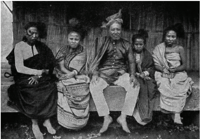
Larawan blg. 9: A Moro datu with his three wives and daughter, Lake Lanao. (Boyce 1914, 160)