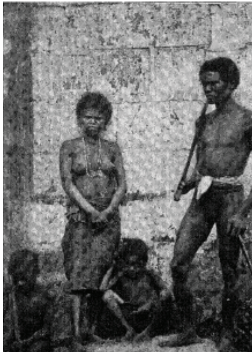
Larawan blg. 1: A Family of Negritos. Apparently the man is only a half-blood. (Hannaford 1900, 23)

na agad na naatasang saliksikin ang maliliit na tribu ng mga “pagano” at “Mohammedan” na naninirahan sa mga kabundukan at malalayong lugar sa arkipelago (Barrows 1901). Sa kaniyang pagsusuri sa sirkular na naglalaman ng gabay para sa field workers na lumabas sa isang booklet na inisyu ng BNCT noong 1901, inilahad ni Rodriguez-Tatel (2010) ang tatlong pangunahing layuning imperyalista sa likod ng nasabing opisyal na imbestigasyong etnograpiko: akademiko/ siyentipiko, komersiyal/ekonomiko, at politikal. Masasabing nakapaloob sa ikalawang layunin ang mga larawan sa mga akda sa paglalakbay dahil upang maging mas mabenta ang mga akdang nabanggit, kinakailangan lamang bigyang-diin ang aspekto ng kanilang pisikal na katangian at kultura na pupukaw sa atensiyon at interes ng mambabasa.