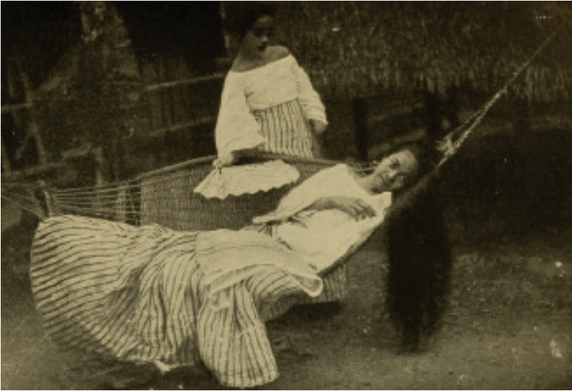
Larawan blg. 11: Filipina Preparing for a Siesta. (Halstead 1898, 188)

katangiang hindi inaasahang taglayin ayon sa Simbahang Katoliko (de Castro, 1864/2005). Maihahalintulad din sa “Reclining Nude” ng mga oil painting ang babaeng nasa duyan, na bagama’t hindi hubo ay alam niyang obheto siya ng “male gaze” na ang ideal na manonood ay lalaki at ang imahen ng babae ay nakadiseno upang mabigyan ng kasiyahan ang lalaki (Berger 1972).