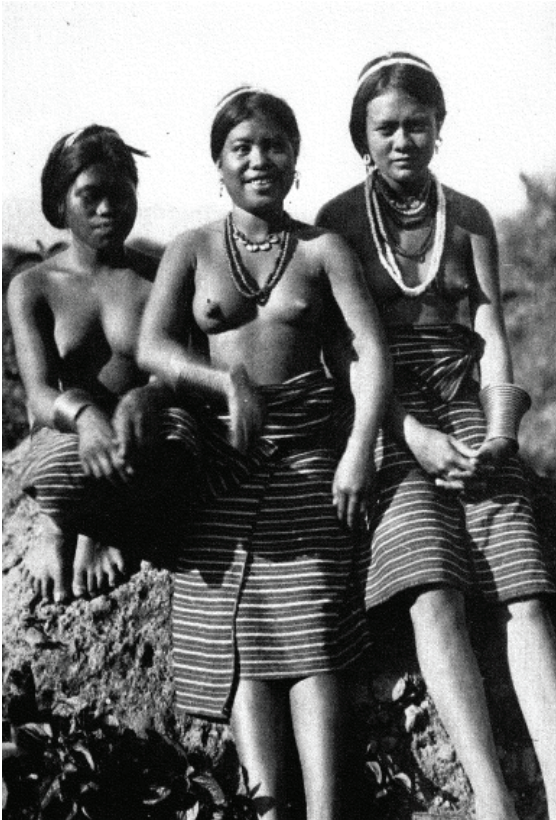
Larawan blg. 5: Ifugao girls. (Barton 1930, 29)

Sa Larawan 5 ay makikita ang tatlong babaeng Ifugaw na nakalantad ang dibdib, nakaupo ang nasa kaliwa at nakatungo, nakatayo ang nasa gitna at nakangiti, habang ang nasa kanan ay bahagyang nakaupo subalit hindi nakatingin sa kamera. May aksesorya silá sa ulo, leeg, at braso. Nakayapak ang babae sa kaliwa at malamang na nakayapak din ang dalawa pang babae sa larawan. Mapapansing mas “relaxed” ang dalaga sa gitna na nakangiti habang may “resistance” pa rin ang nasa kanan at kaliwa.