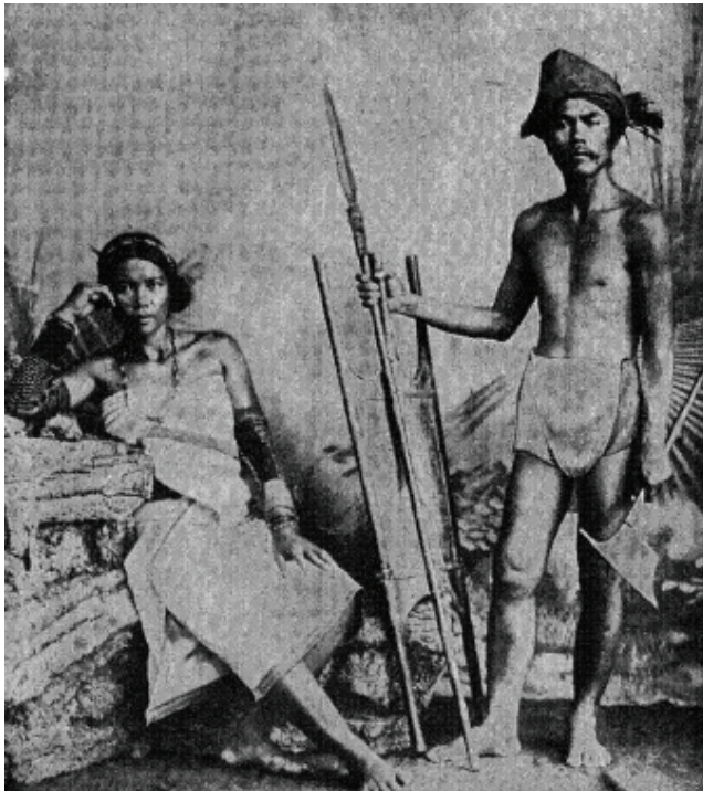
Larawan blg. 2: Head-Hunting Gaddang and Wife. (Hannaford 1900, 26)

Sa Larawan 2 na nagpapakita ng mag-asawang Gaddang na nakatayo ang lalaki at may hawak na sibat at kalasag, nagpapahiwatig naman ito ng kaniyang papel sa pakikidigma habang ang babae ay nakaupo at nakadikit ang kanang kamay sa pisngi. Pansinin din na ang lalaki ay nakabahag at may nakabalot na tela sa ulo habang ang babae ay may suot na pang-itaas at pang-ibaba at may aksesorya sa kaniyang leeg at braso. Pareho siláng nakayapak, nakatingin sa kamera, at mapapansin ang artipisyal na kapaligirang pilit pinalabas na likás na kapaligirang may mga halaman.