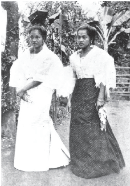
Larawan blg. 15: Typical Filipino Women of the Better Class. (Williams 1913, 179)

kababaihan mula sa maykayang pamilya na kadalasang kinukuhanan ng larawan na nakatayo, nakatingin sa kamera, at nasa studio o bahay na bato, habang ang kababaihan mula sa pangkaraniwang pamilya ay kadalasang nasa harap ng kanilang bahay-kubo, mas simple ang pananamit, nakayapak, at ipinakikita kaugnay ng mga partikular na gawain. Sa Larawan 15 ay makikita ang imahen ng kababaihan mula sa maykayang pamilya, na ayon nga sa kapsiyon ay mula sa “better class” o mula sa mas mataas na uring panlipunan. Ayon kay Atkinson (1905), ang kababaihan sa Pilipinas mula sa maykayang pamilya ay mas may kalamangan sa kalalakihan sa usaping ekonomiko, at mas mataas ang posisyon kaysa sa mga kababaihan sa ibang bansang Asyano katulad ng India, at ito ay dahil diumano sa kanilang pagiging Kristiyano bunga ng kolonyalismong Espanyol.