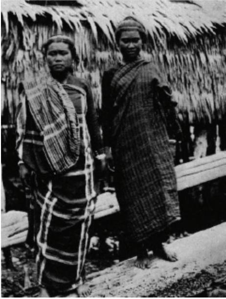
Larawan blg. 6: Moro Women. (Atkinson 1905, 253)