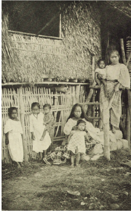
Larawan blg. 12: The Tagal families are large, it being not uncommon for a woman to have eight or ten children. They are affectionate, docile and polite. (Neely 1899, w. pah.)

Sa Larawan 13 ay makikita ang kababaihang nagtatrabaho bilang cigarrera o manggagawa sa pabrika ng tabako. Nakabaro't saya silá, nakapusod ang buhok, nakasalampak sa lapag habang nagtatrabaho sa mababang mesa sa kanilang harapan. Mapapansing may kabataang babae subalit karamihan ay matanda. May isang lalaking nakatayo na tila nagbabantay sa kanilang pagtatrabaho. Ang pagiging manggagawa sa pabrika ng tabako ay isa sa mga gawaing inako ng kababaihan simula huling bahagi ng ika-19 na dantaon. Habang sa Larawan 14 ay makikita ang isang babaeng Bisaya na naghahabi. Sa Kabisayaan ay pinahalalagan ang paghahabi bilang isang gawain ng kababaihan, at sinasabing ito ay isang gawaing nangangailangan ng ibayong kasanayan.