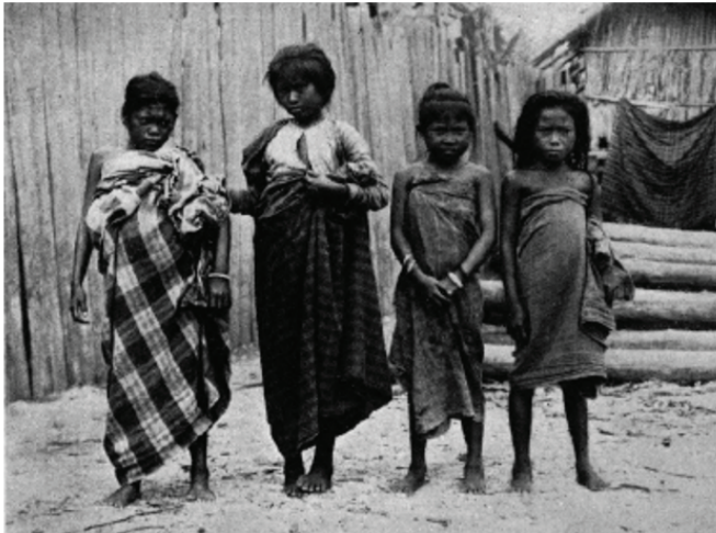
Larawan blg. 7: Group of Moro Girls. (Atkinson 1905, 255)