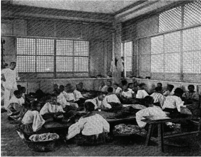
Larawan blg. 13: Cigar-Making in Manila Employing Only Women and Girls. The little squares or diamonds in the immense windows have ground concha-shells in lieu of glass. (Hannaford 1900, 72)