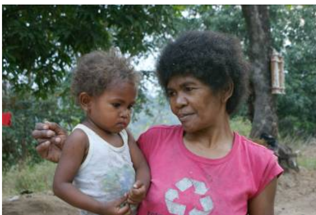
Larawan 1.1. Imahe ng mag-inang Ayta

Ang mga Ayta na nasa paligid ng Bulkang Pinatubo ay bahagi ng mga Negrito group sa Pilipinas. Kung pagbabatayan ang kanilang panlabas na katangian, makikilala ang mga Negrito sa kanilang balat na matinkad na kayumanggi, kulot na buhok,