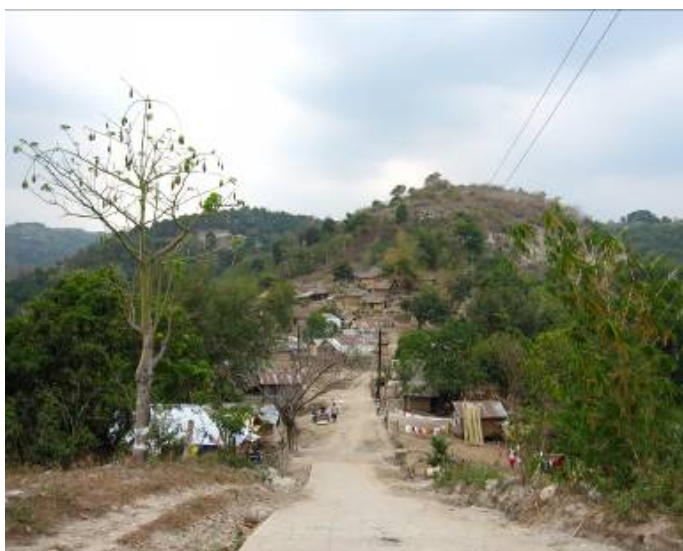
Larawan 1.4. Imahe ng Sitio Tarik sa Villa Maria.

Kung babalikan ang Larawan 1.3, makikita na ang dating lugar ng