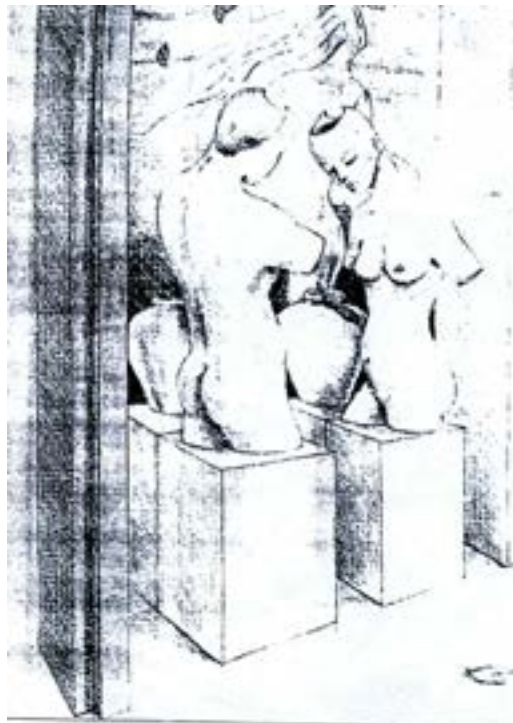
Larawan Blg. 1.0 Lorem ipsum

Bawat bahagi ng mukha ay may sari-sariling kakanyahan: noo, kilay, pilik-mata, mata, ilong, bibig, labi, dila, ngipin, nguso, baba, at pisngi. Tingnan natin ang ilang matalinhagang kakanyahan ng bawat isa: