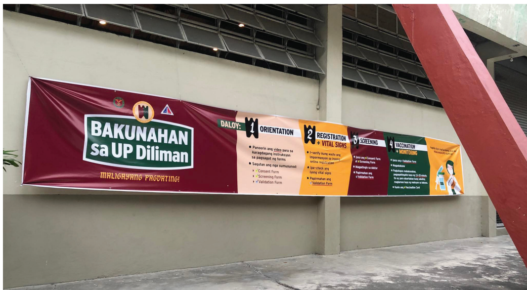
Figura 1. Karatula sa labas ng Bakunahan sa UP Diliman. Ipinapakita nito ang apat na hakbang sa daloy ng pagbabakuna sa loob.

Tila kontra-agos sa maladigmaang lapit ng rehimen sa krisis, kinuha ng maraming komunidad at organisasyon ang oportunidad na mag-organisa ng sari-sarili nilang tugon sa pandemya tulad ng Community Pantry, volunteer groups, at relief operations. Dagdag pa rito ang Bakunahan sa Unibersidad ng Pilipinas (UP) Diliman, isang vaccination center na pinangunahan ng UP Diliman COVID-19 Task Force (Fig. 1). Nilayon ng proyektong nagsimula noong Abril 2021 na (1) mabakunahan ang mga kawani at manggagawa sa loob ng UP Diliman at (2) makatulong sa Lungsod Quezon sa pagbabakuna ng mga residente nito. Laking bigla ng mga organisador ng proyekto na nakapagpakilos ito ng maraming boluntaryo mula sa iba't ibang sektor, disiplina, at komunidad. Tagumpay ng Bakunahan ang pagturok ng 37,000 dosages bago ito magsara noong Disyembre 2021.