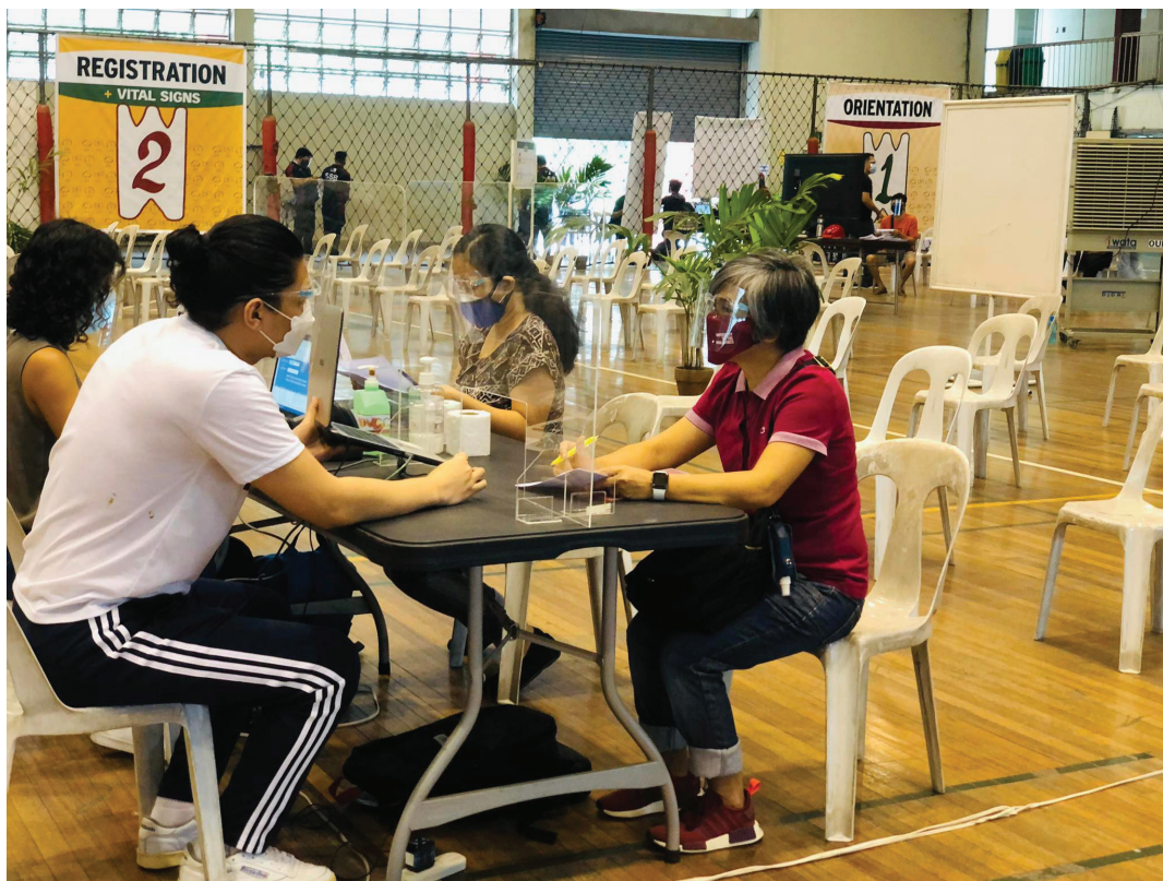
Figura 4. Ginagamit ng mga IT Volunteer ang programang pinaunlad nila para sa Bakunahan upang matiyak ang pagtatalá ng impormasyon ng mga pasyente.

Naging malaki rin ang papel ng mga artista sa Sining Biswal. Gamit ang kaniláng kaalaman sa pinakamabisang disenyo ng impormasyon at komunikasyong biswal, tiniyak niláng madalíng makita at maunawaan ang mga karatulang gumagabay sa daloy ng tao sa Bakunahan. Ang mga boluntaryong may kasanayan sa paggamit ng mga aplikasyon sa kompyuter ay tumulong sa pagsasaayos ng iba pang datos para sa proyekto. Mayroon ding mga boluntaryong tumayóng tsuper ng mga van kung sakaling mayroong kailangang dalhin sa ospital, at marsyal na umiikot-ikot upang tumutulong sa mga pasyenteng dumadaan sa Bakunahan.