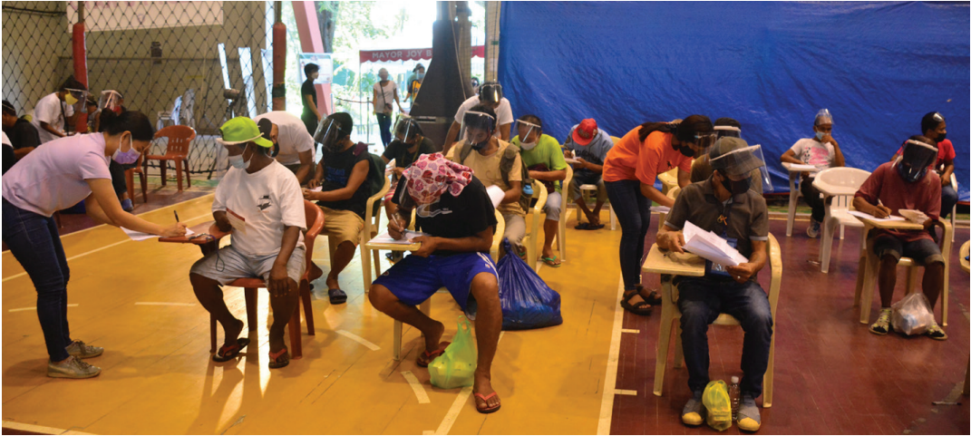
FIGURA 6: Retrato ng pagbabakuna sa mga benepisyaryo ng Konsorsyum