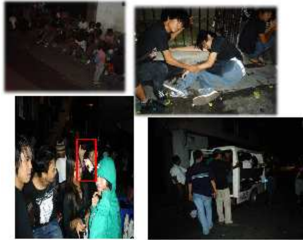
Larawan 10. Ang mga pangyayari sa Kalye Bocobo mula sa pagtambay sa kalye, pagkalango sa alak hanggang sa paghuli ng pulis sa mga kabataan ng kasong bagansiya.

Sa normal na okasyon naman ay makikita na kalimitan sa mga taong ito ay hindi naman tumatangkilik sa mga establisimyento. Bagama't mura ng pagkonsumo ng alak, pinipili ng karamihan ng mga grupo/clan ang pagpatak-patak at bumili ng Brandy , softdrink litro at plastic cup , at pampulutan sa malapit na sari-sari store, Mini-stop o 7-11. Sa Kalye Bocobo korner Kalye Alonzo mag-iinuman at pagkaraa'y humahara sa daan.