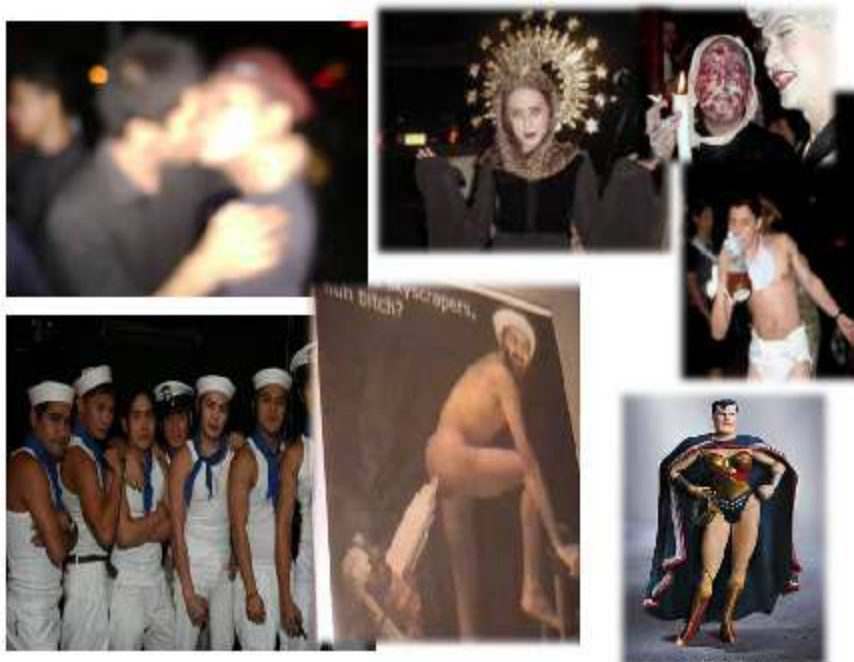
Larawan 9. Mga pangyayari at mga imahen sa Kalye Orosa na bumabasa(g) sa dominanteng kaayusang panlipunan partikular ang patriyarkalismo.

espasyo ng Malate ay site/sight rin ng subersiyon laban sa namamayaning kaayusan. Taunang ginaganap sa Kalye Orosa ang White Party tuwing Hunyo bilang pagdiriwang sa unang gay liberation movement na tinaguriang Stone Wall Riot sa New York. 36 Tema ng mga kasuotan ay puti o kostyum ng mga kilalang gay icon . Kapag Nobyembre, tinatawag itong Black Party, isang Halloween Party. Inoorganisa ang mga ito ng mga establisimiyento ng Orosa. Madalas na isinasara ang mga kalye para sa street party .