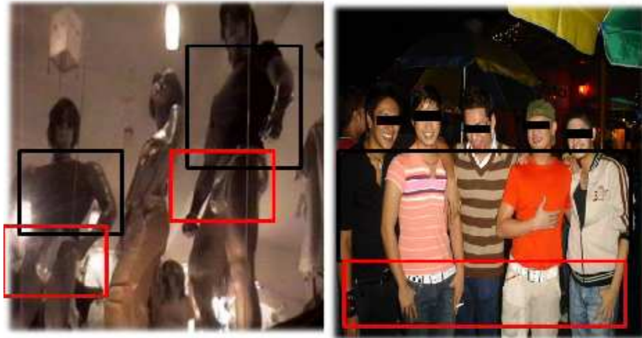
Larawan 1. Mga nakadisplay na manikin (kaliwa) sa homorium 22 ng Pride Exchange sa Kalye Orosa . Tila may pagkakatapareho ang mga manikin na ito sa ikonograpiya ng sining Griyego base sa idealisasyon ng katawan at ang kontra-posto ng tindig at tikas. Ang mga manikin na ito naman ay tila sumasang-ayon sa suot ng karamihan ng taong pumupunta doon. Ang slim cut at fitted na pantalon na nagpapakita ng depinisyon ng katawan ng mga nagsusuot nito. 23

o Converse na sapatos, laslas ang pantalon, o bag. Mayroong may dalang gitara at iba pa.