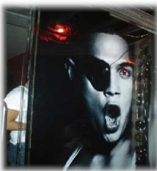
Larawan 5. Isang malaking adbvertisement sa establisimyentong “O” sa pagitan panulukan ng Kalye Nakpil at Kalye Orosa.

Binibigyang empasis din ang mata na kulay pula at hugis O rin, at nabibigyang komplimento ng kabuuang itim at puting kulay at tekstura ng imahen. Ang lokasyon ng kulay pula at mata ay tila bumabagay sa karanasan ng mga taong kalimita'y pinaïral ang pagtingin. Maaaring nagpapaigting ng sitwasyon ang kulay na pula, nagdirin sa kasikipan, kasiyahan, pagmamahal, karahasan, at seks. Bago pa ang “O” ay naging bar pa ito na may pangalang Red Banana . Para sa mga berde (malaswa) ang utak, ang saging ay mapaglalaruan sa isip bilang ari ng lalaki.