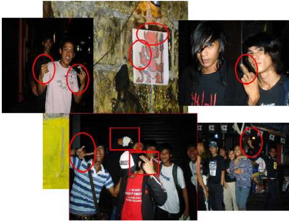
Larawan 4. Makikita ang mga sinyales ng kamay at daliri (ang F*** sign, bang-bang sign at devil sign) ng mga taong namamalagi sa Kalye Bocobo ay katulad ng postura ng “baby devil” na imahe ang sungay at ang sinyales din ng kamay.

Maituturing itong paglabag na esteryotipikong praktis ng sub-kultura. Inilulugar din ang larawan ng simbolismo hindi bilang espirituwal na salik kundi bilang popularisasyon at redepinisyon ng simbolismo ng subersiyon at kung ano ang astig o kulturang popular para sa kanila. Kapansin-pansin din sa mga taong ito ang bang-bang sign o senyas na inihuhugis baril ang daliri o kamay na esteryotipikong praktis ng mga grupong hip-hop. Maaaring malayang impluwensiya at apropiyasyon ito ng mga senyal at code na ipinalalaganap ng iba’t ibang salik tulad ng media o konteksto ng rumble ng magkabilang panig. Sa mga pag-eetnograpiya sa espasyo, lagi na lamang nagkakaroon ng rumble sa magkabilang panig ng Kalye Bocobo. Ito ang girian ng West side at East side. Karaniwang nakatambay sa West side ang mga hiphop at sa East side ang mga punk, trasher, metal at iba pa. Ngayoy hindi ko na napapansin ang bisibilidad ng mga hip-hop. Malay din naman ang mga taga-Bocobo kapag dumaraan sa kalye ng Orosa at alam nila kung sino ang dominanteng gumagamit ng espasyo nito. Sa kanilang pagmamapa, karamiha’y