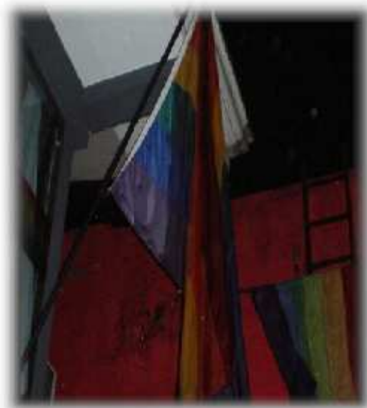
Larawan 6. Ang Rainbow flag na nakasabit sa isang establisimyento ng Kalye Orosa . Signipikasyon ito ng dibersidad ng mga kasarian gayundin ng teritoryalisasyon ng espasyo bilang dominanteng ginagamit ng mga bakla .

pagsulong sa karapatan ng LGBT, at seksuwal o simbolo ng pagnanasa ang ikalawa.