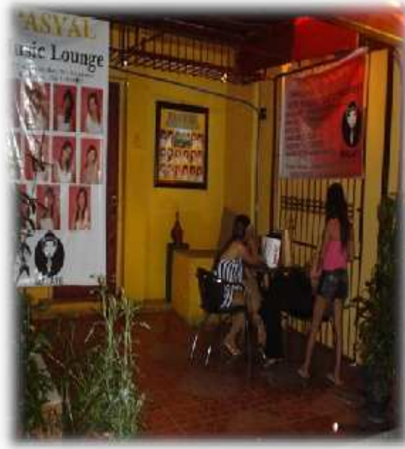
Larawan 7. Ang establisimyentong Pasyal na dati ay Biology Cafe sa Kalye Bocobo.

na larawan at pati na rin ang mga lalaking nag-iimbita. Sa Supermen nagpapalabas ang mga baklang stand-up comedian . Ang dating Biology , isang gay bar , ay ginawa ng Pasyal na may salin sa Koreano ang signboard. Dito nakadispley ang mga larawan ng mga babaeng GRO sa isang tarpulin.