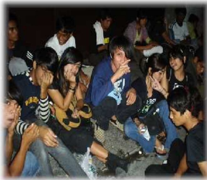
Larawan 2. Mga grupo ng kabataan na karaniwang tinatawag na clan o tribe na nakatambay sa kalye ng madilim na bahagi sa pagitan ng Kalye Orosa at Kalye Alonzo.