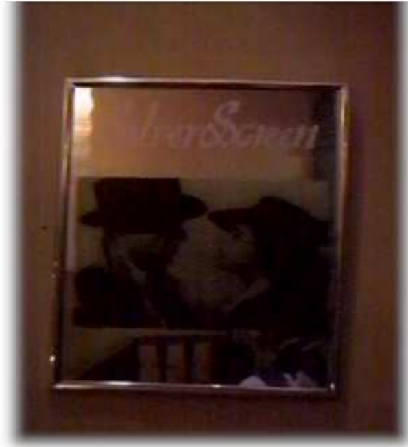
Larawan 8. Isang imahen ng lalaki at babae na nakadispley sa nagsara nang Spirits Coyote sa pagitan ng kanto ng Kalye Nakpil at Kalye Bocobo.