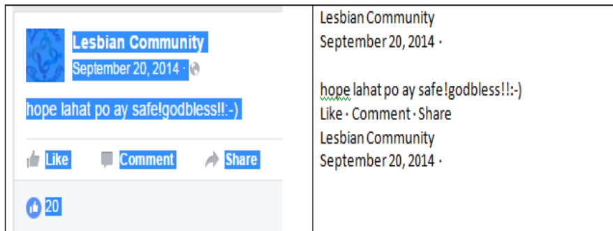
Figura 2. Halimbawa ng isang post na naka-highlight (kaliwa) at ang resulta kapag kinopya na ito sa isang word editor (kanan)

Tumutukoy ang mga regular expression sa mga anyo ng teksto na puwedeng gamitin para maghanap ng partikular na salita o pattern sa isang dokumento. Makapangyarihan ito dahil maaari itong gamitin para markahan at tanggalin ang isang pattern gamit lamang ang mga simbolo, letra, at numero (Kushman at Barzilay 827). Bilang halimbawa, kung mano-manong kukunin ang mga post, sadyang makonsumo ito sa oras. Kung iha-highlight naman lahat at kokopyahin, masasama rito ang mga simbolo na hindi kailangan kagaya ng halimbawa sa Figura 2.