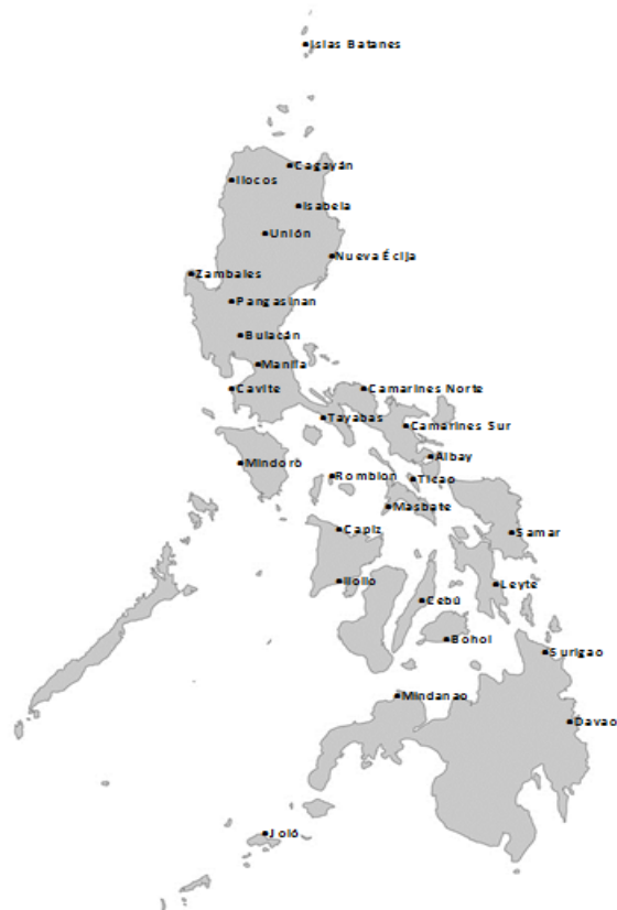
Poblaciones con médico a finales del siglo XIX 4

Antes de 1880, los escasos médicos que había en Filipinas pertenecían al Ejército o a la Armada. Hasta principios del año 1881 no se convoca una plaza de médico en Manila 3 . Posteriormente se crean los puestos de atención sanitaria a cargo de un