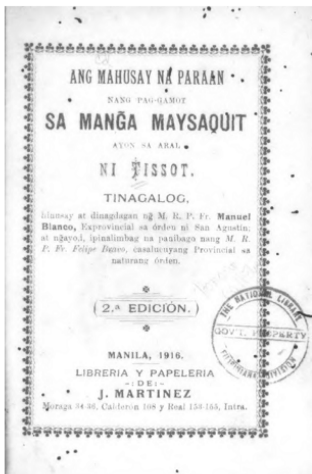
Portada de la edición de 1916