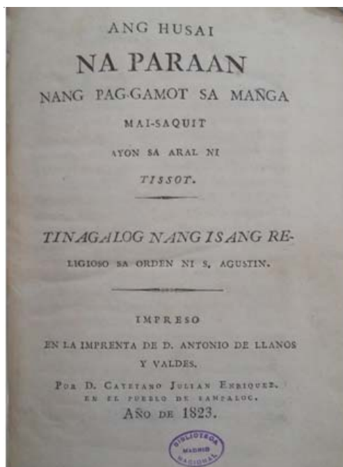
Portada de la edición de 1823

La otra obra, del jesuita Pablo Clain, se tituló Remedios fáciles para diferentes enfermedades . No está pensada para los indígenas, sino que en la portada dice: para alivio y socorro de los PP. Ministros Evangélicos de las Doctrinas de los Naturales (Clain 1712).