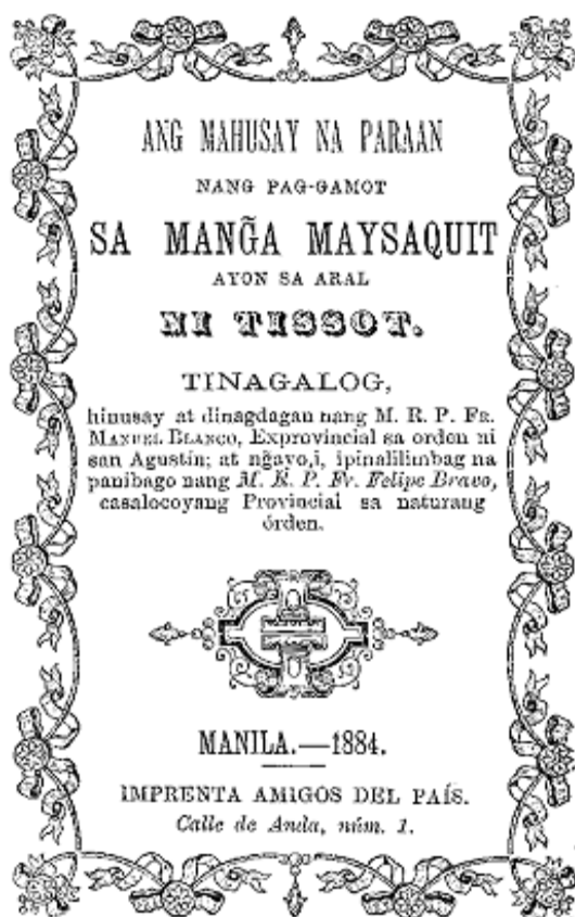
Portada de la edición de 1884