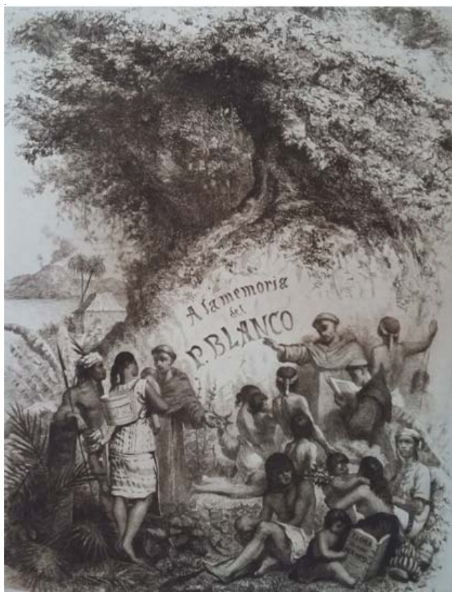
Grabado de la Flora Filipina que deja ver la actitud del P. Blanco con los indios

Después de toda una vida de dedicación a los filipinos, el P. Manuel Blanco murió en el convento de Guadalupe de Manila el 1 de abril de 1845.