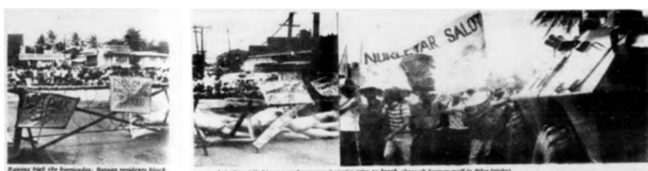
Figura 3. Larawan, “Raising high the barricades” sa edisyong Mayo–Hunyo 1985 ng Liberation (National Democratic Front).

Mula sa mga inisyal na pagsabak nito sa huling bahagi ng 1984, naging sunod-sunod na ang paglulunsad ng mga welgang bayan sa taong 1985, kung saan tampok ang mga welgang bayan sa maraming bahagi ng Mindanao sa okasyon ng Pandaigdigang Araw ng Manggagawa noong Mayo 1, 1985 at mga welgang bayan na nagparalisa sa mga siyudad ng Bacolod sa Negros, Legaspi sa Albay, at Iloilo sa isla ng Panay patungo sa pagdiriwang ng Pandaigdigang Araw ng Karapatang Pantao noong Disyembre 10 (CPP, “Mga Welgang Bayan” 5).