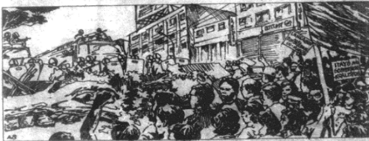
ANG BAYAN / Disyembre 1984 / 3

Se mabilis at istrategikong paralissasyon ng normal na aktibidad, gaganap ng susing papel ang pangkalahatang welga ng malaproletaryado sa linya ng transportasyon. Motibong puersa rin ng welgang bayan ang industrial na pagbigwas sa kaaway ng mga barikada na importanteng sangkap ng welgang bayan. Ang pangkalahatang boykot ng mga istudyante ang titiyak sa pangkalahatang katangian ng welgang bayan, laluna't mahig-