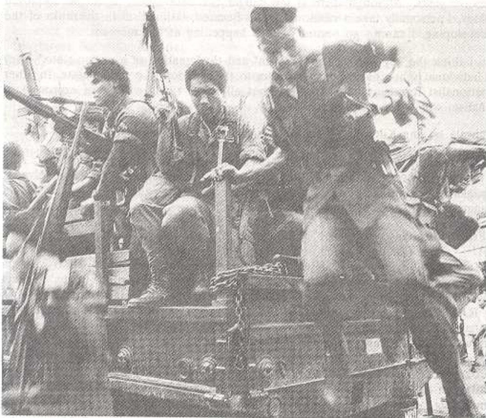
Philippine soldiers: future liberators?

nandyan na ang mga taong handa sa nasyonalismo. Kaya lang medyo nagtagal ang proseso kung ikumpara mo sa UP. Ang problema ng YOU ay ang "log time," ang pagkahuli sa mga pangyayari na naranasan na ng ibang mga institusyon ng lipunan na ngayon pa l a n g nararanasan ng militar. Katakot-takot pang political developments a n g magaganap sa