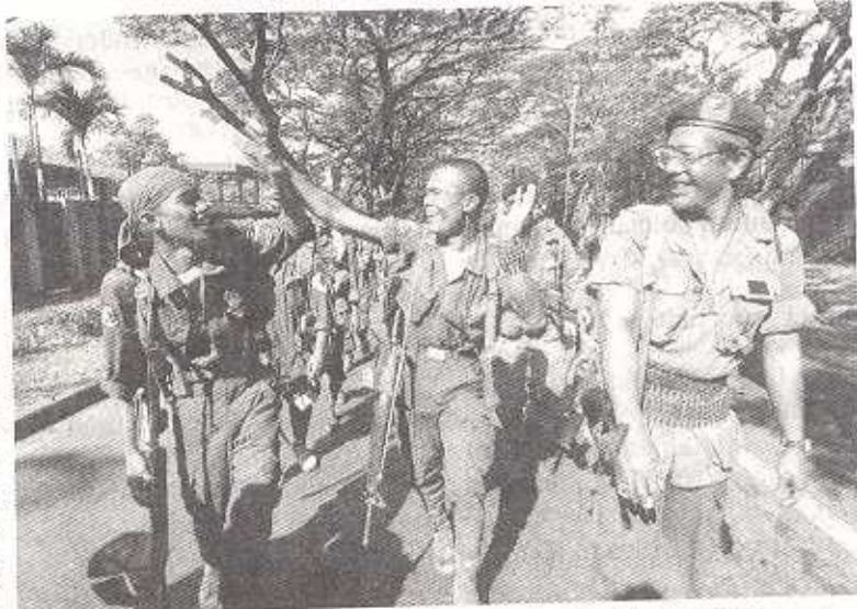
Coup-cum revolution: Rebel soldiers after the Makati siege.