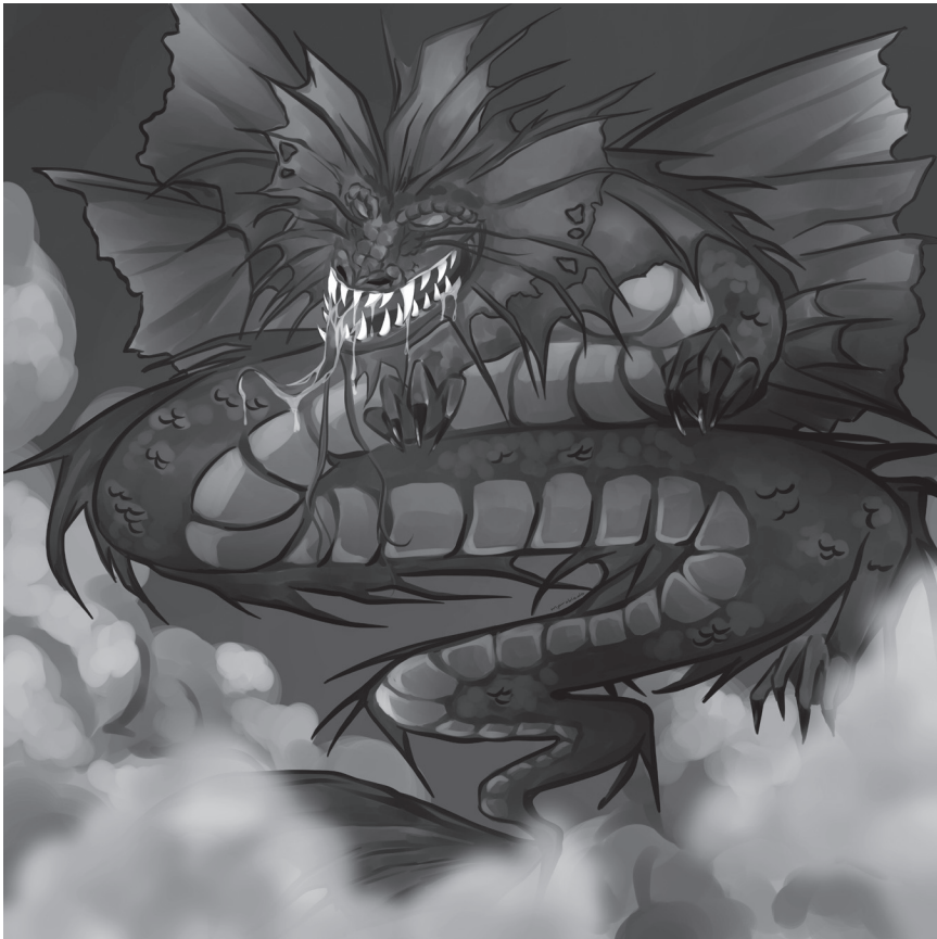
Larawan 1: Bakunawa

Ang mga larawang ito ay piling pangyayari at tauhan mula sa kuwento. Isasama sa aklat ang mga larawan kung papalaring mailimbag ang akda. Lahat ng ito ay nilikha ni Michelle Robledo.