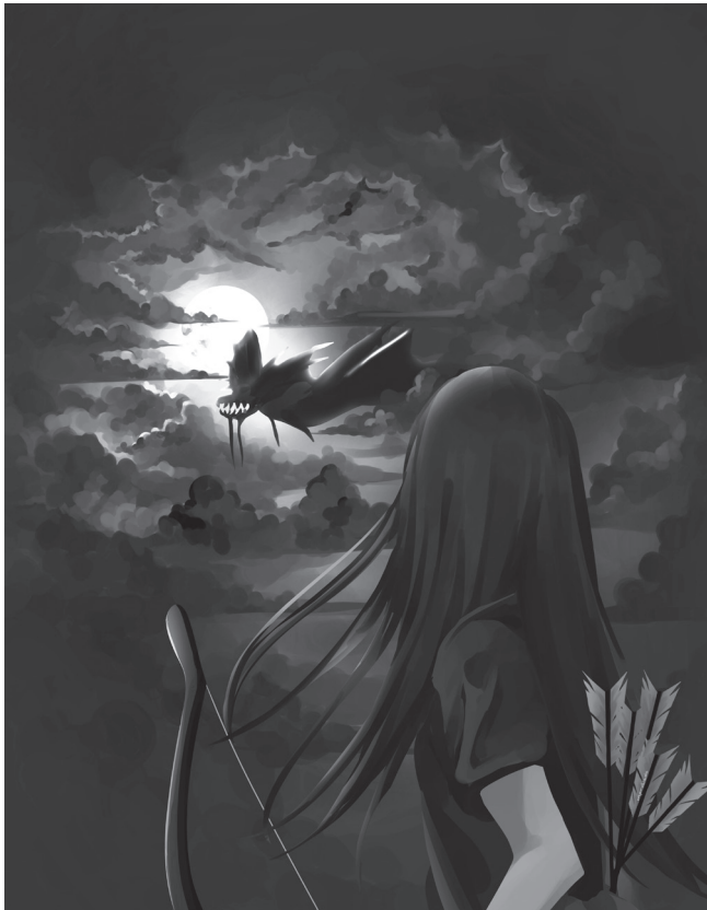
Larawan 4: Pagharap ni Iska sa Bakunawa Kung papalaring maging aklat, ito ang napili kong maging pabalat.