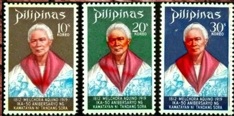
LARAWAN 3. Mga selyong inilabas nuong 1969, sa kanyang ika-50ng guning-taon ng pagpanaw. http://alexmoises.tripod.com/id216.html ... (A.2.1. sa loob ng texto.)