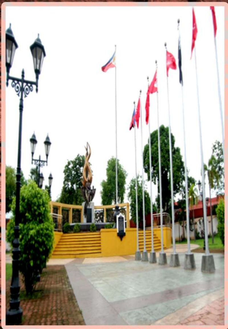
LARAWAN 7.2. (A.6 sa loob ng textong.)