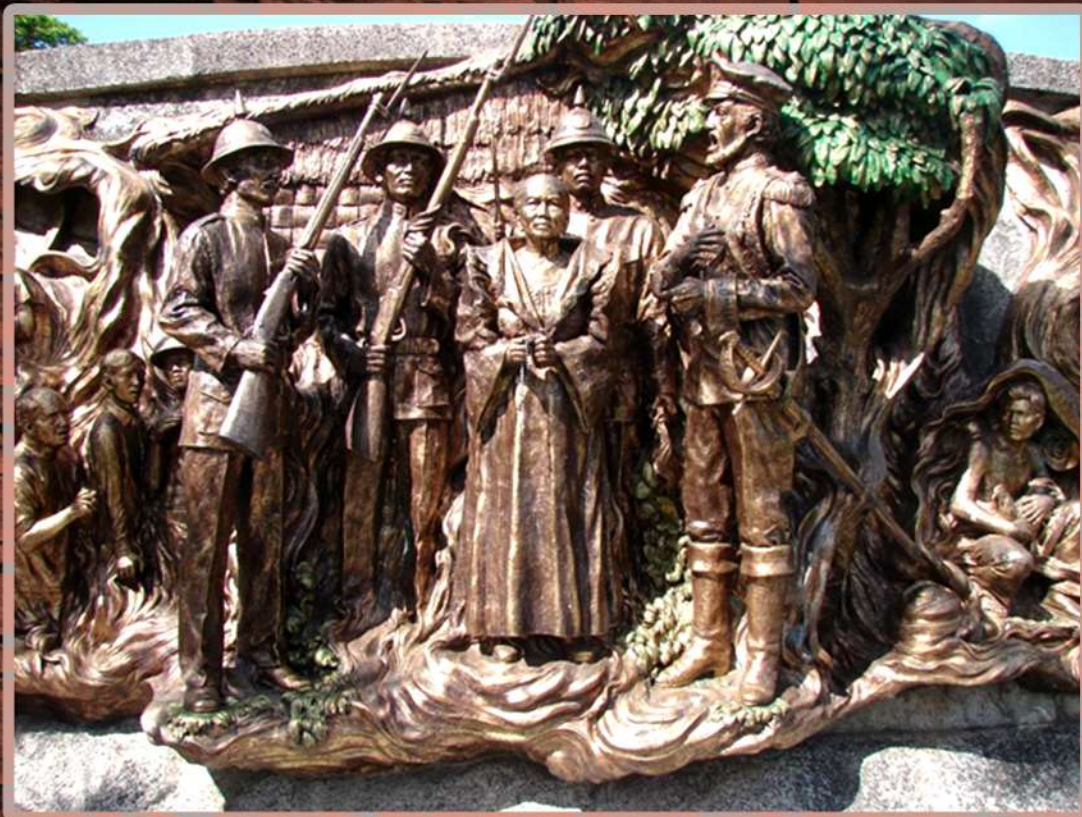
LARAWAN 5. Mural ng kaniyang pagkadakip bago ipatapon sa Guam (Caedo, 1971), sa Himlayang Pilipino, Pasong Tamo, Lungsod Quezon. Kuha ni J.B. Veneracion, 2012. (A.4. sa loob ng texto)