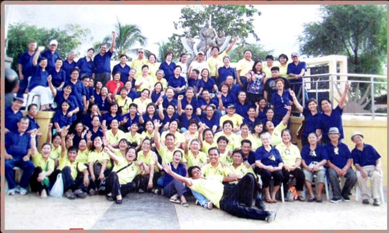
LARAWAN 10. Larawan ng Mga Apo ni Tandang Sora, Ika-3 at Ika-4 na salinlahi (Kuha mula sa Tandang Sora Shrine, Banlat, Quezon City, 2012. Photo on display.)