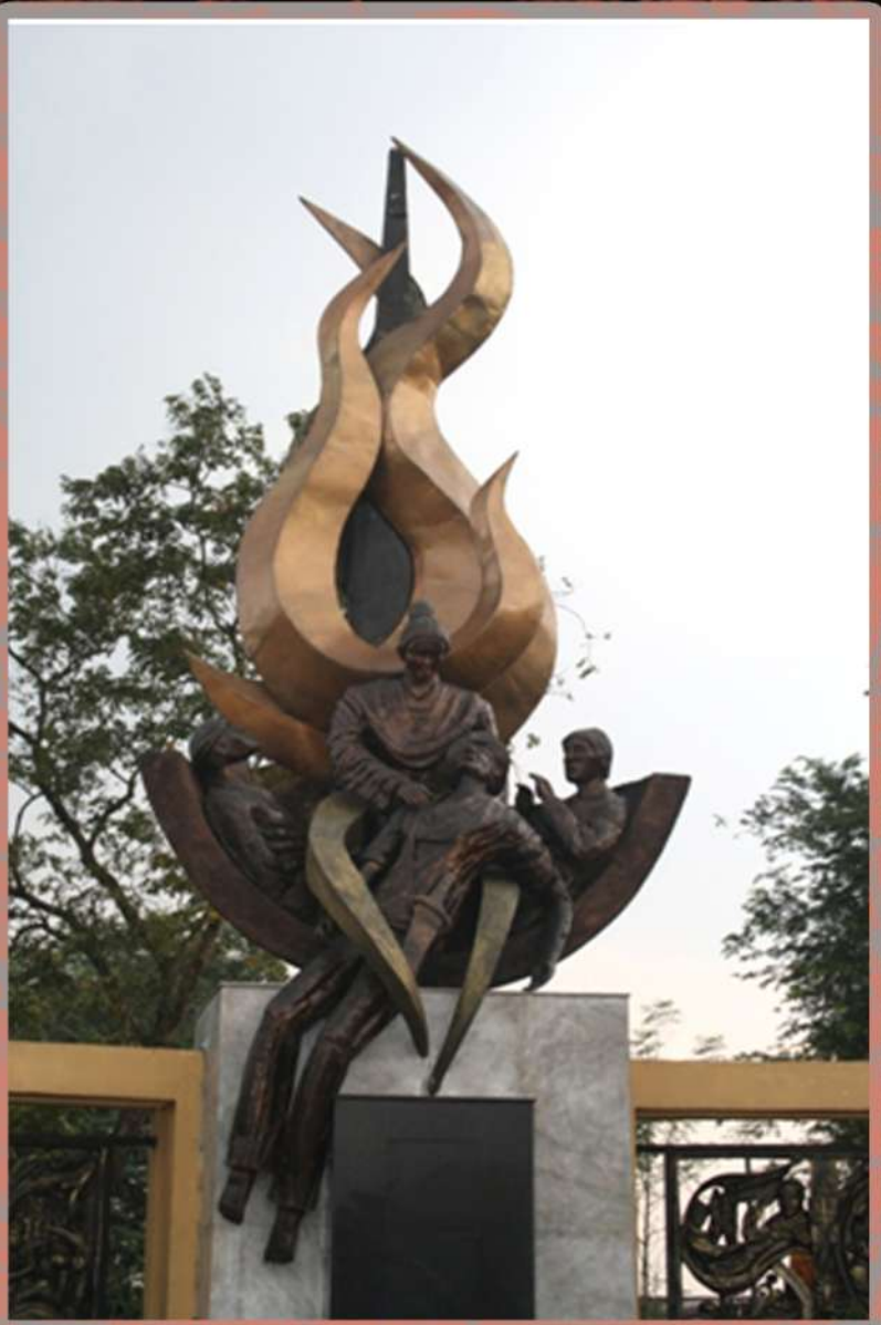
LARAWAN 7. Bagong Dambana ni Tandang Sora (Imao, 2012), Banlat Rd., Brgy. Tandang Sora, Lungsod Quezon 7.1. (A.6. sa loob ng texto.)