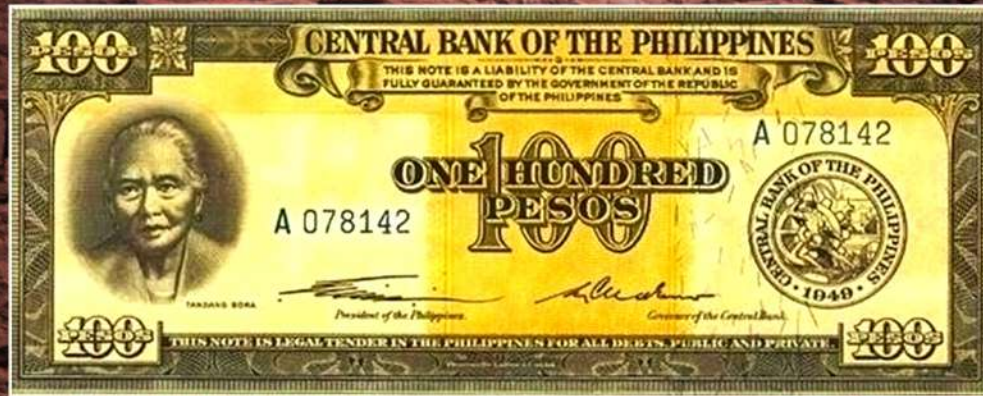
LARAWAN 2. Lumang P100 salaping papel na may mukha ni Tandang Sora. Central Bank of the Philippines ENGLISH SERIES, issued 1951 P100 piso http://www.bsp.gov.ph/bspnotes/evolution/BSPNotes/EnglishSeries.pdf (A.2. Sa loob ng texto)