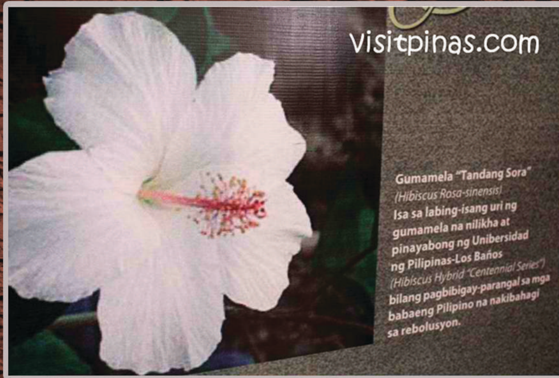
LARAWAN 8. HIBISCUS TANDANG SORA ( Hibiscus rosa-sinensis ) (A.7. sa loob ng texto)

http://visitpinas.com/discovering-tandang-sora-shrine-in-quezon-city/gumamela-tandang-sora-hibiscus-rosa-sinensis/